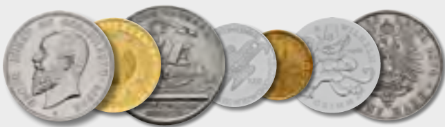
Historische & moderne Münzen Sammlungen & Einzelstücke

Unsere Experten bieten Ihnen eine kostenlose, professionelle und unverbindliche Beratung - fair und transparent