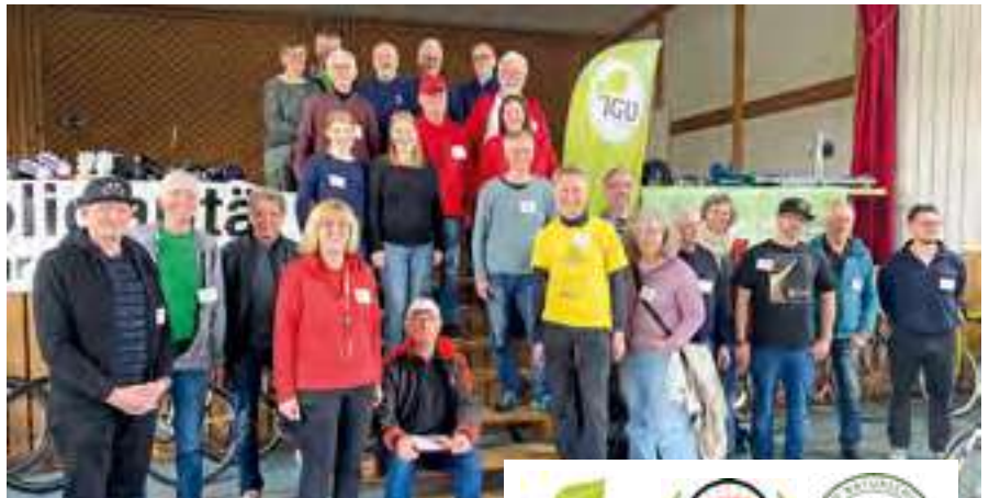
Drei Vereine, ein tolles Team: Die Helferinnen und Helfer des 31. Rimpärer Fahrradflohmärktes.