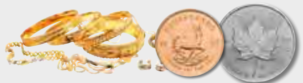
Schmuck & Edelmetalle aller Art

Wir kaufen auch Zahngold, Tafelsilber, Versilbertes, Zinn, Banknoten, Orden und Medaillen.