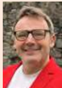
Uwe Beck (SPD)